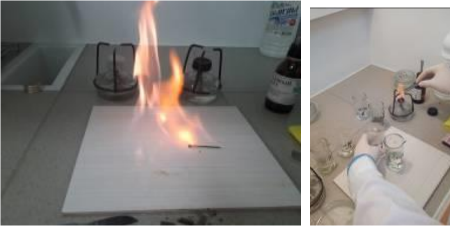
Рис. 8 Обжигание (фламбирование) кафельной плитки и инструмента