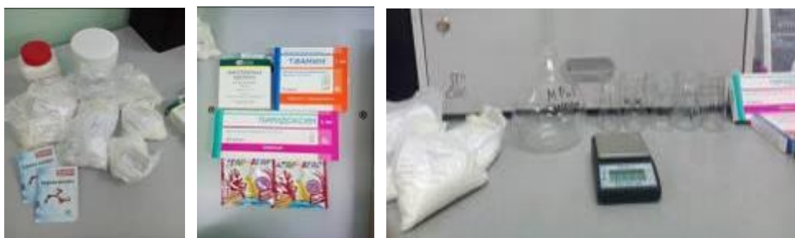
Рис.2 Посуда и химически реактивы для приготовления питательной среды