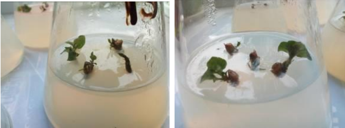
Рис. 14 «Микрочеренки» на стерильной питательной среде