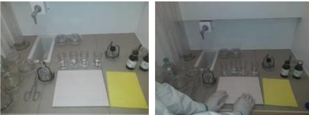
Рис. 9 Организация рабочего места