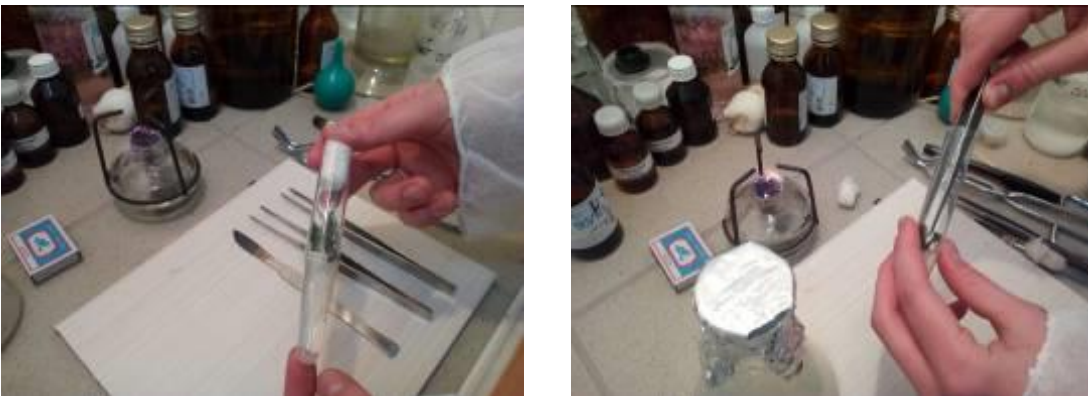
Рис.12 Извлечение асептических проростков из пробирки