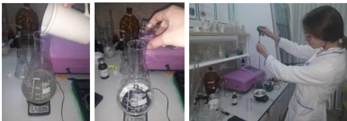
Рис.4 Приготовление питательной среды