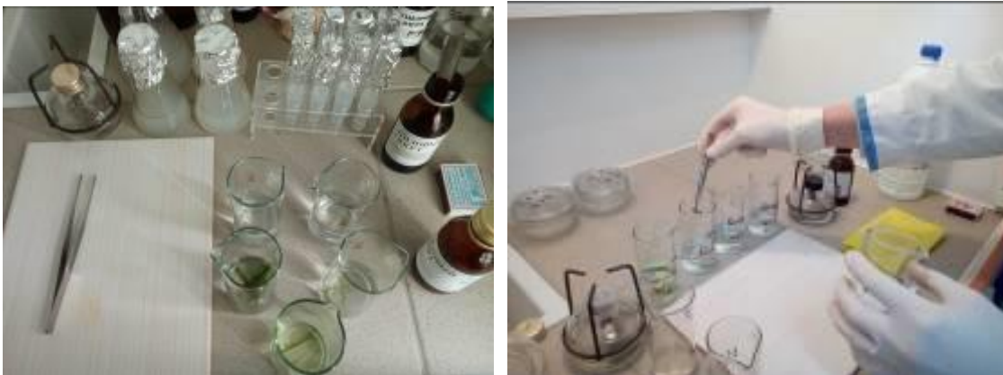
Рис. 7 Стерилизация растительного материала