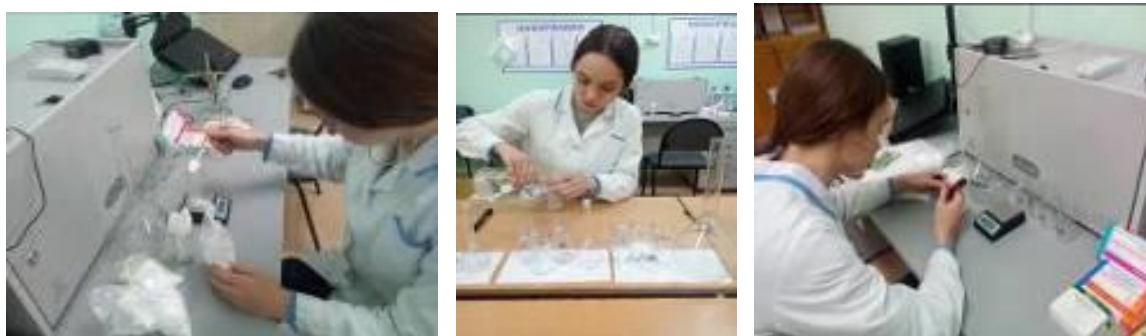
Рис.3 Приготовление маточных растворов