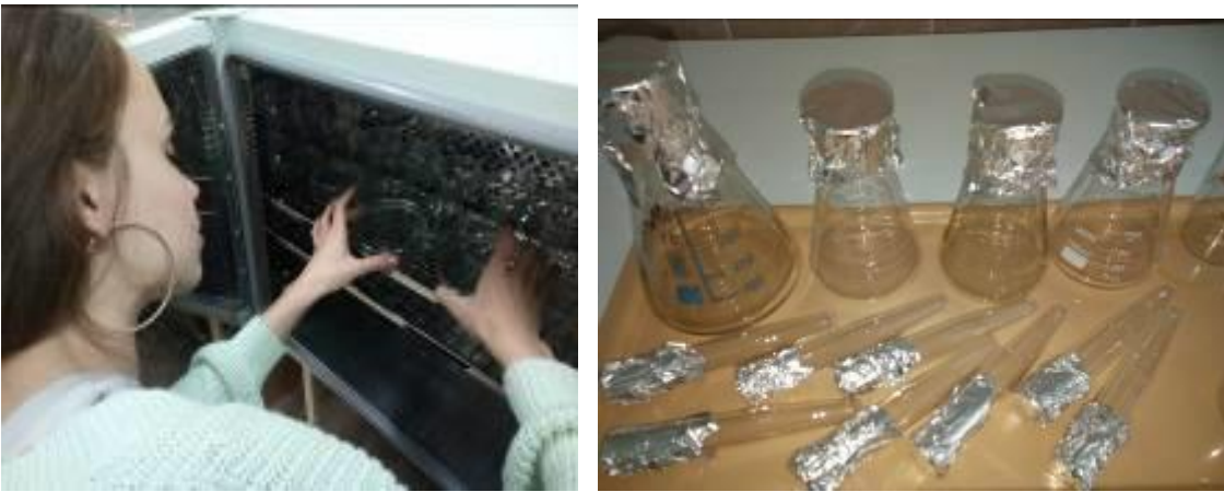
Рис.6 Стерилизация посуды и питательной среды