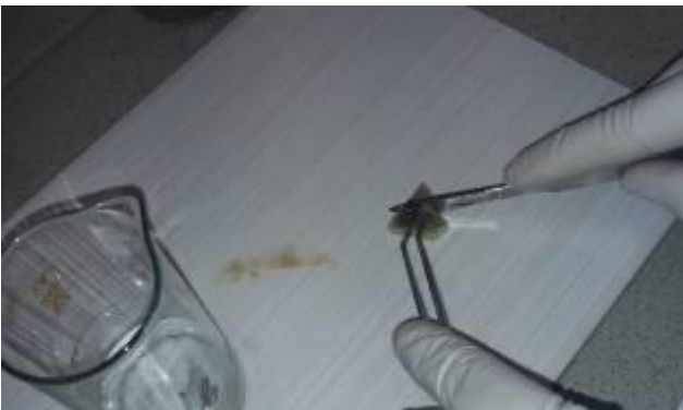
Рис. 10 Удаление верхушечной меристемы и нарезка частей экспланта