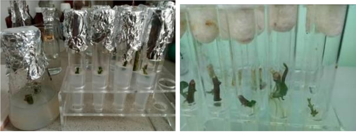
Рис. 11 Экспланты растений в пробирке (in vitro)